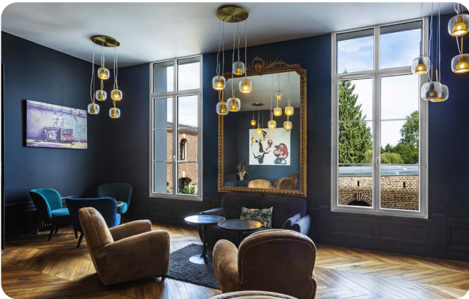
PVC Saison® : Fenêtres à la française 2 vantaux avec impostes vitrées et petits bois collés en Blanc RAL 9016