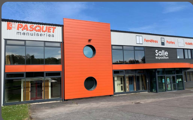
Agence de Saint-Maclou (27)