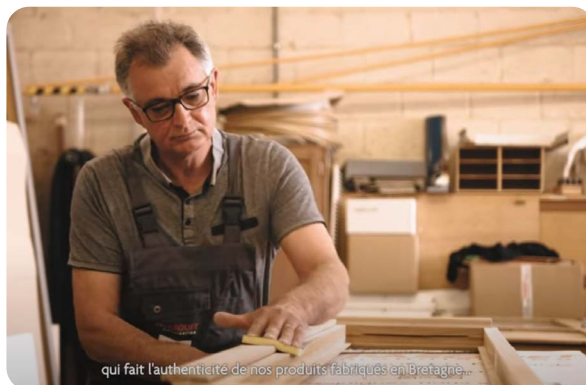
qui fait l'authenticité de nos produits fabriqués en Bretagne...