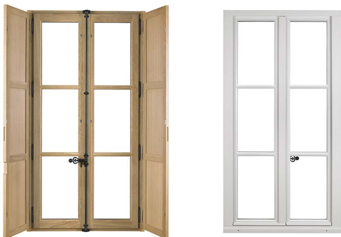
Vue intérieure (Chêne) et extérieure (Blanc RAL 9016)