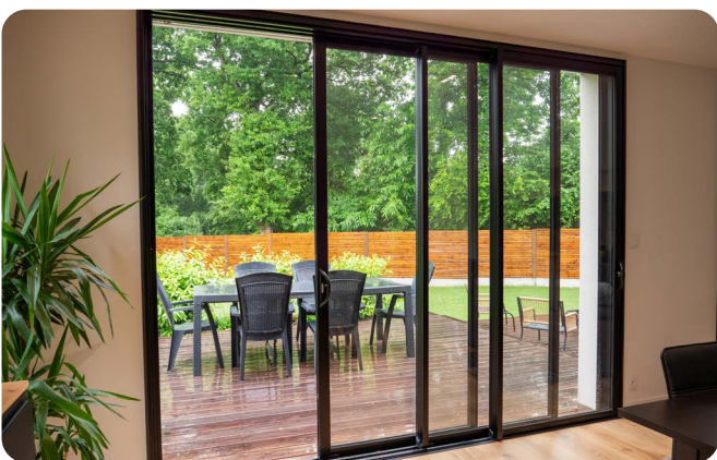
Aluminium Empreinte® : Porte-fenêtre coulissante 3 vantaux en Noir RAL 9005