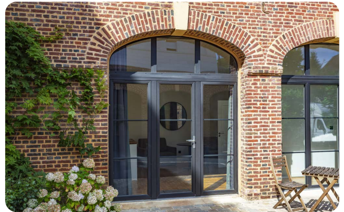
PVC Saison® : Ensemble composé en PVC 2 vantaux avec impostes, fixes vitrés et petits bois collés en Gris RAL 9007