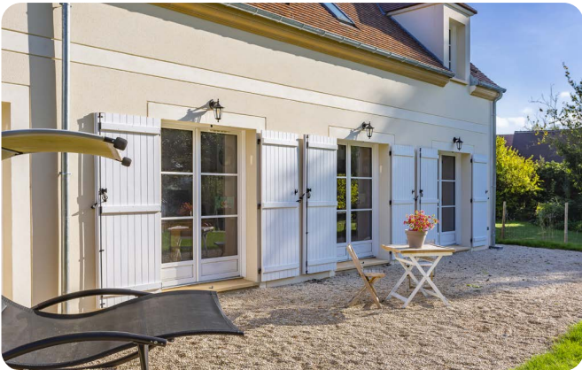
Bois Lignal® : À gauche, Portes-fenêtres à la française 2 vantaux avec petits bois collés Lignal® et à droite, Porte d'entrée en bois Molène et Fenêtres fixes avec petits bois collés Lignal® en Blanc RAL 9016