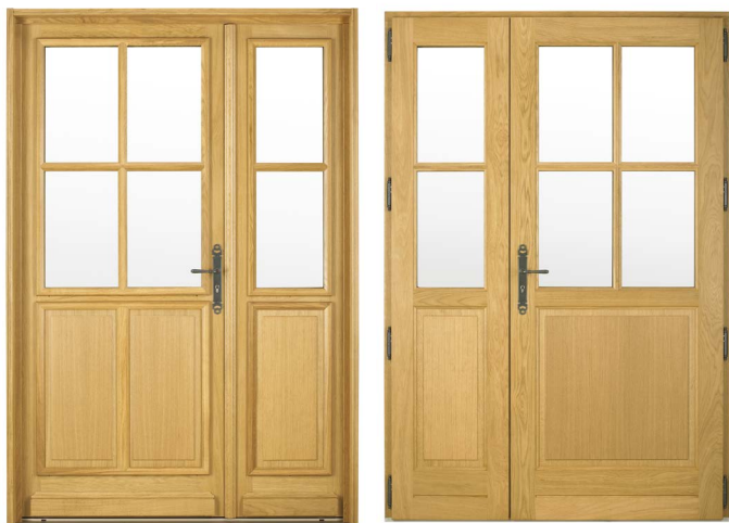
Vue extérieure et vue intérieure