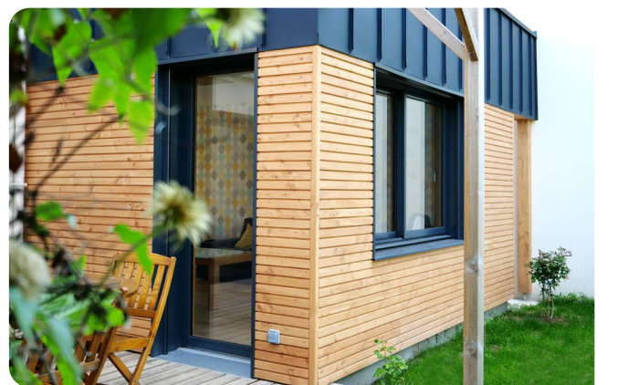
Mixte Auralu® : Fenêtre à la française et Porte-fenêtre 1 vantail en Gris RAL 7016